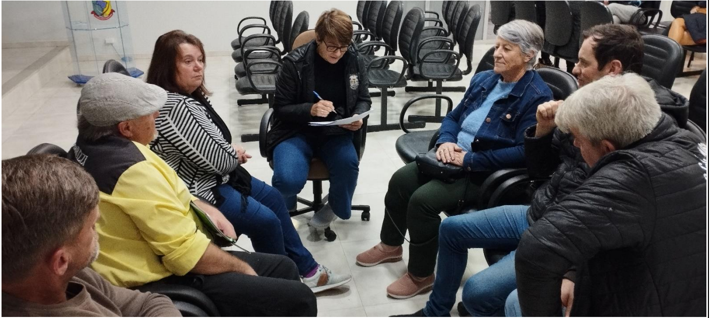
-Grupo de Trabalho