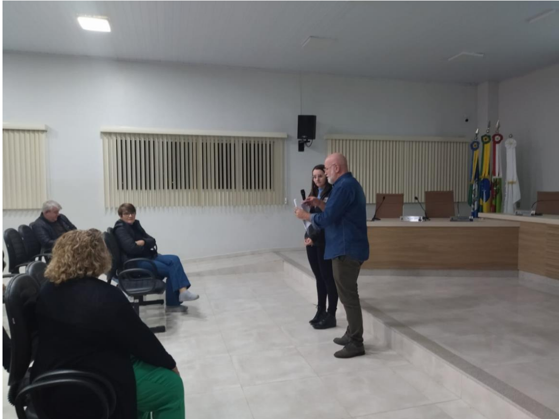
-Apresentações das propostas na Plenária