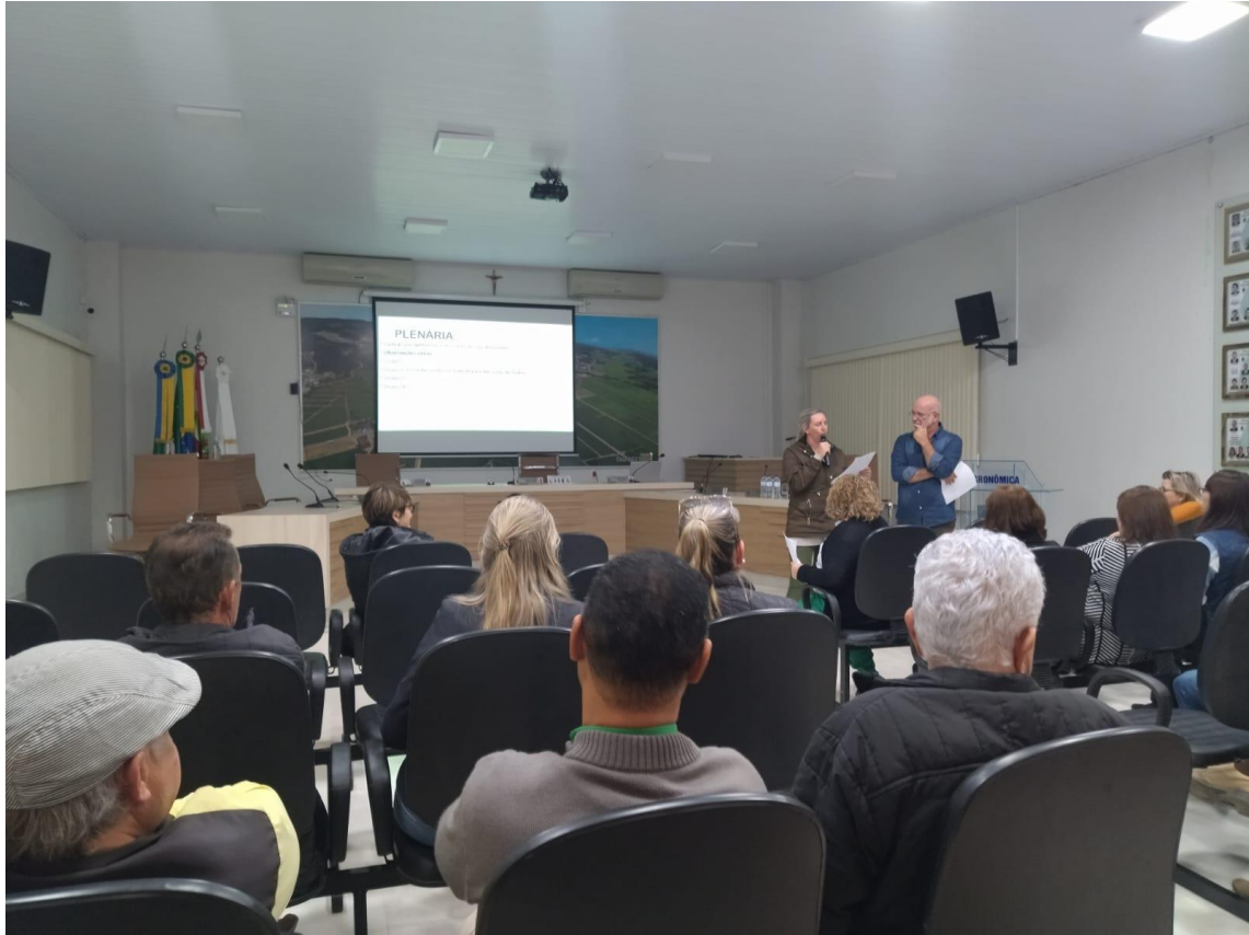
-Apresentações das propostas na Plenária