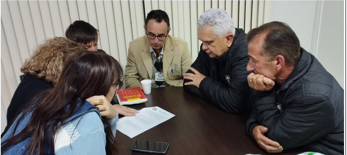
-Grupo de Trabalho