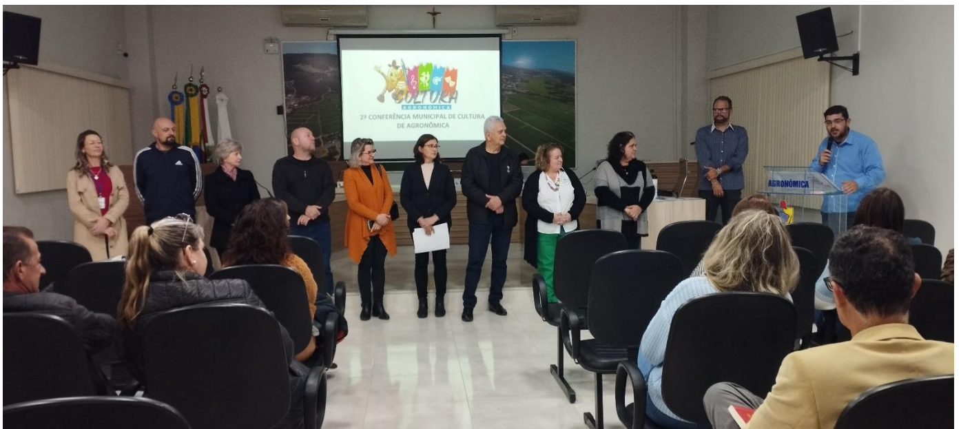
- Coordenado do Colegiado de Cultura da AMAVI