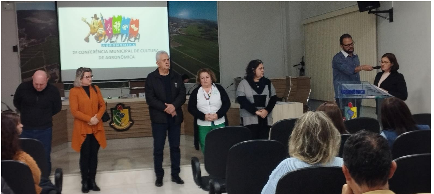
-Presidenta donselho Municipal de Cultura