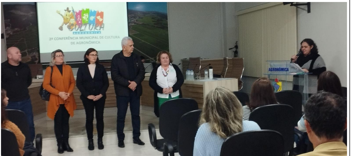
-Diretora de Educação, Cultura e Desporto.