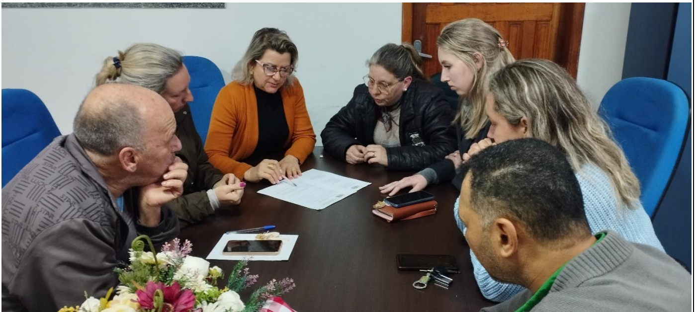
-Grupo de Trabalho