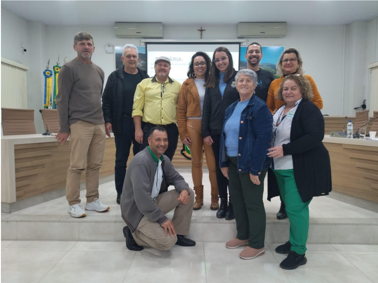
-Novos Conselheiros e Conselheiras de Cultura com o Prefeito Municipal e com a Agente Cultural.