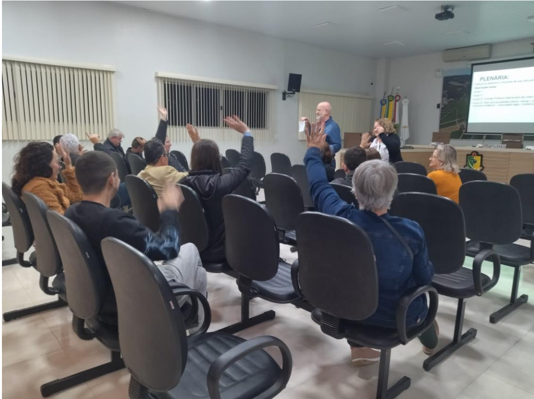
-Eleição de novos Conselheiros de Cultura