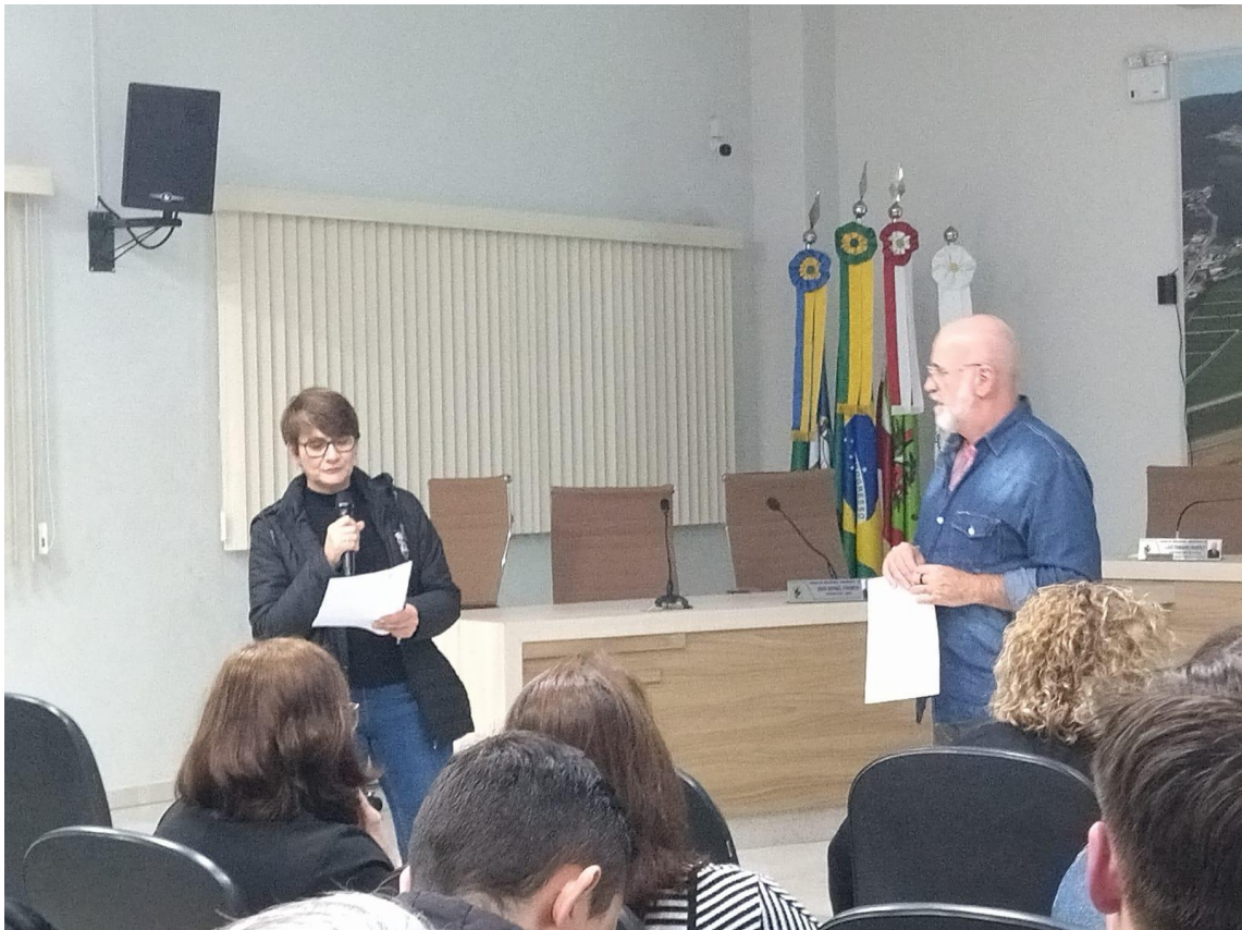
-Apresentações das propostas na Plenária