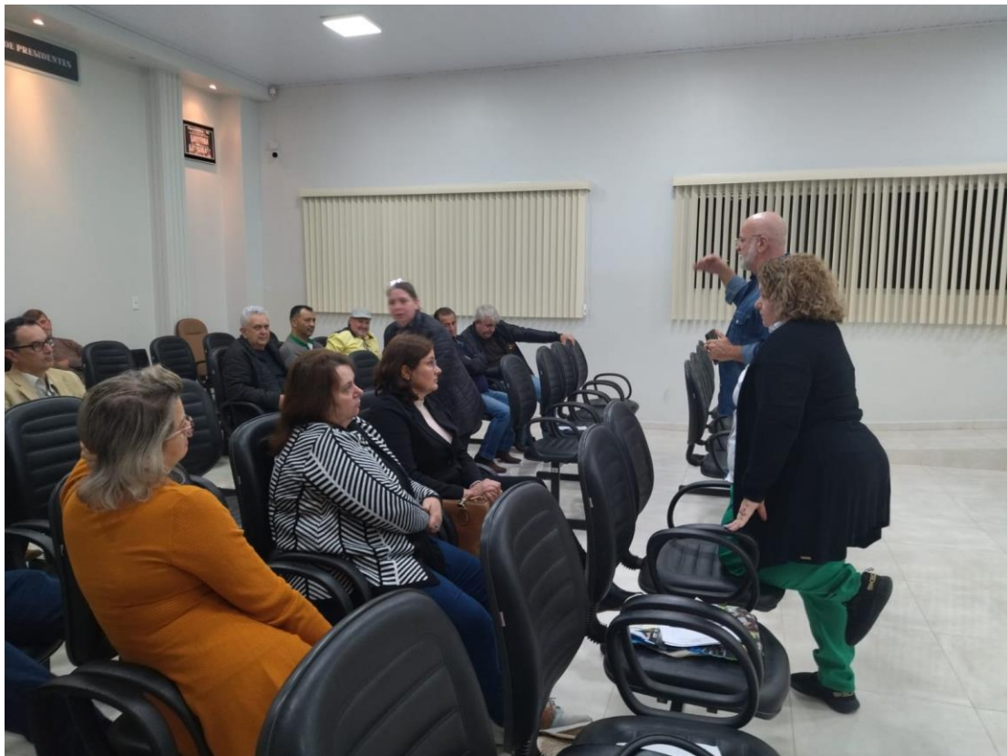
-Apresentações das propostas na Plenária