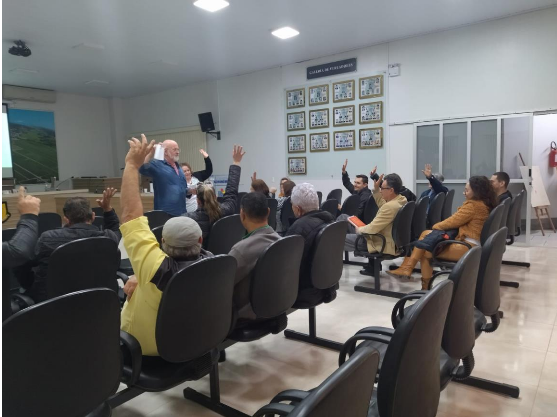
-Eleição de novos Conselheiros de Cultura