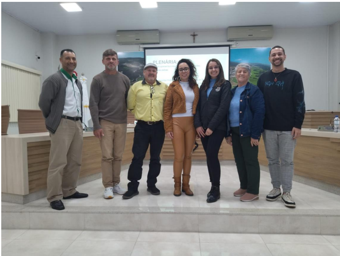
-Novos Conselheiros e Conselheiras de Cultura