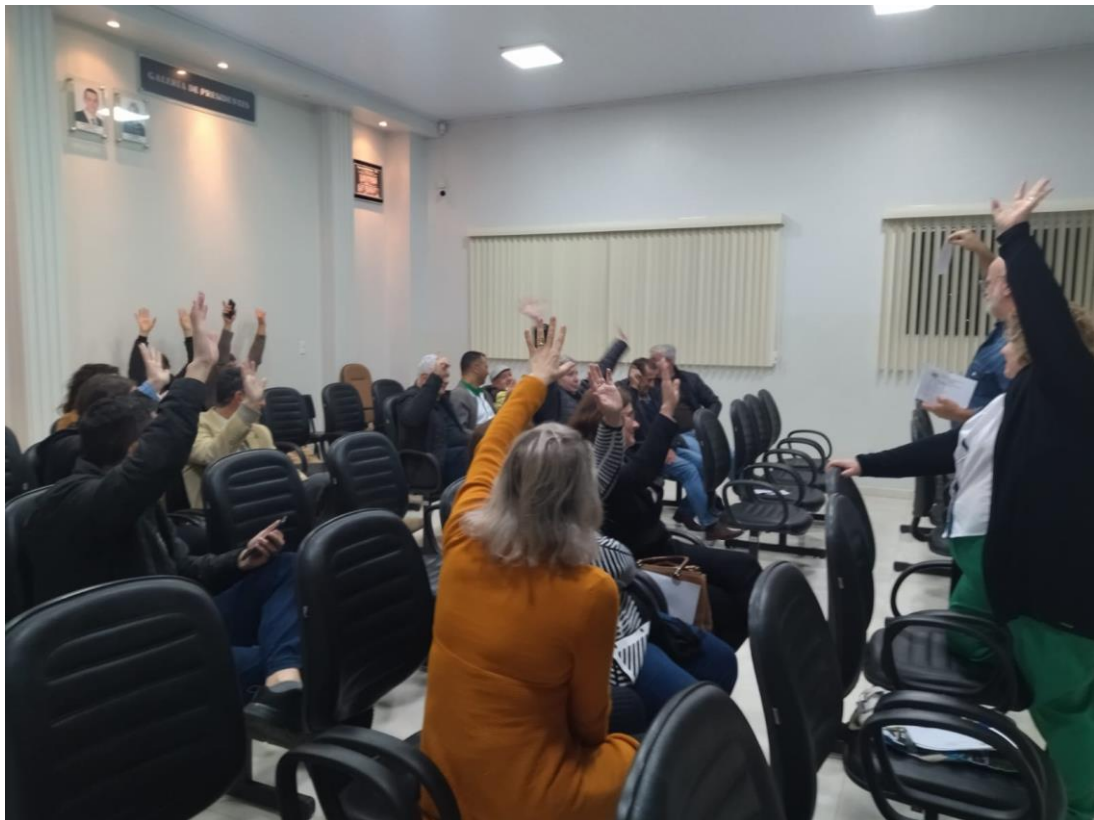
-Eleição de novos Conselheiros de Cultura