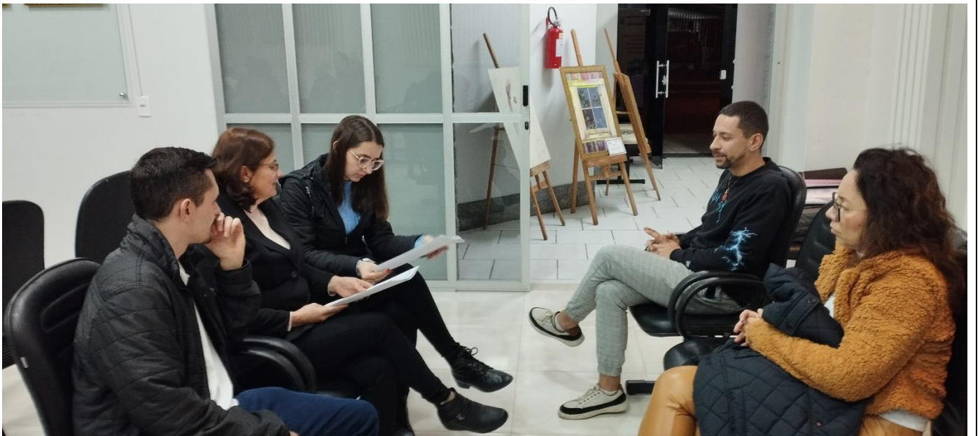
-Grupo de Trabalho